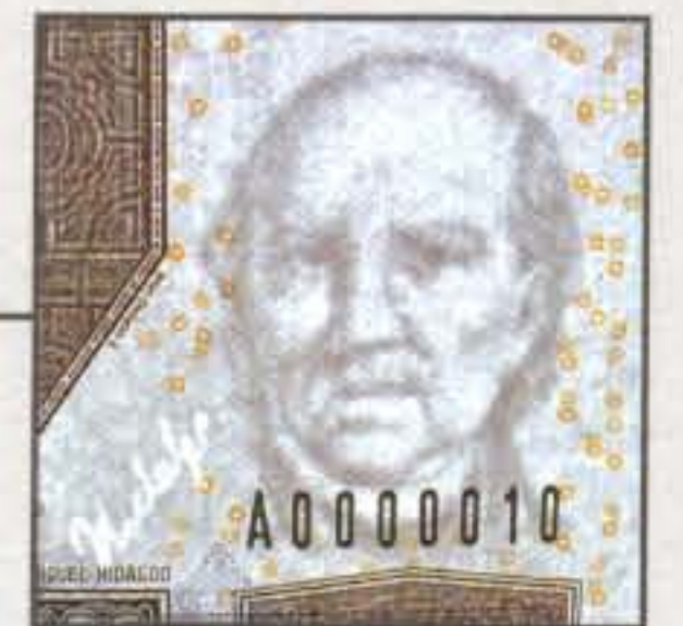
Imagen de Miguel Hidalgo y Costilla, formada en el papel, visible a contraluz, en tonos claros y oscuros, acompañada por la firma de dicho personaje, también visible a contraluz, en un tono claro.